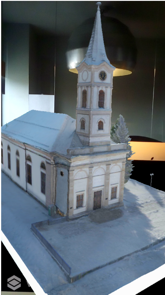
Model 3D dla markera poziomego