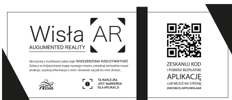
Marker należy przykleić np. na ścianie