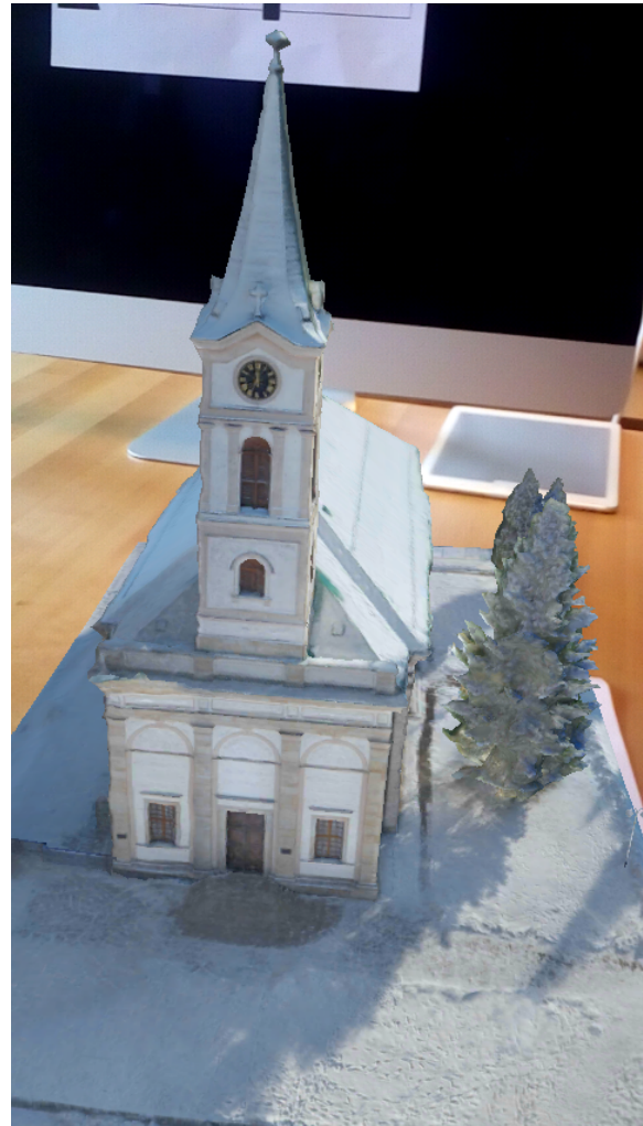
Model 3D dla markera pionowego